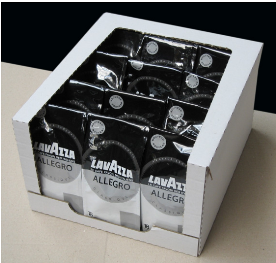
Abb. 1 Verpackungsmuster einer B&B-MAF Combimatic

Mit der B&B-MAF-„Combimatic“ kann man alternativ und mit wenig Umstellarbeit Produkte in Trays, Hochboard-Trays, Trays mit Deckel, Display-Trays mit Stülpedeckel und Wrap-Around-Kartons verpacken.