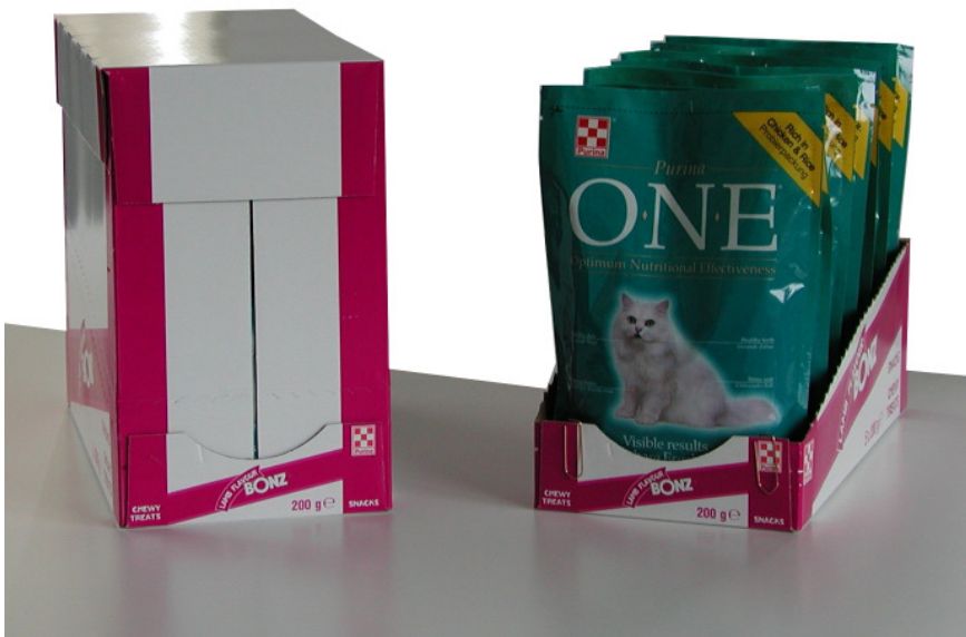
Doy-Packs im Display Karton (verpackt auf B&B-MAF COMBIMATIC)